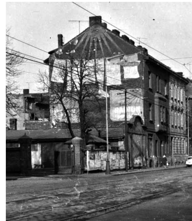
V těchto místech v Nádražní ul. se nacházel internační tábor pro německé obyvatelstvo

Moderuje Martin Tomášek z Ostravské univerzity. Ve spolupráci se spolkem PANT.