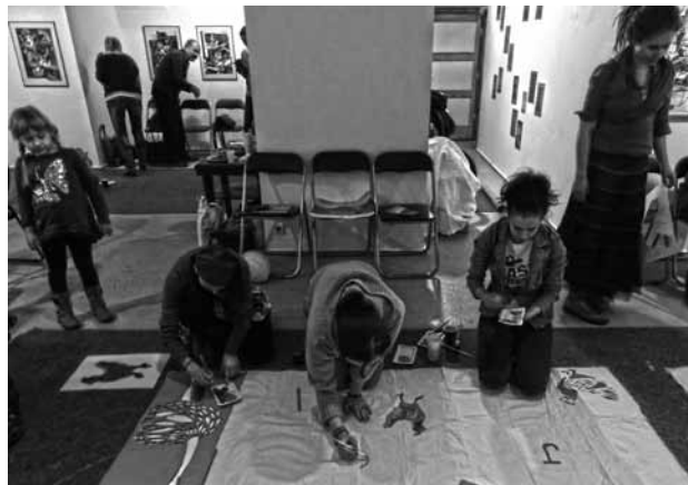
Výtvarný ateliér pro děti a jejich rodiče