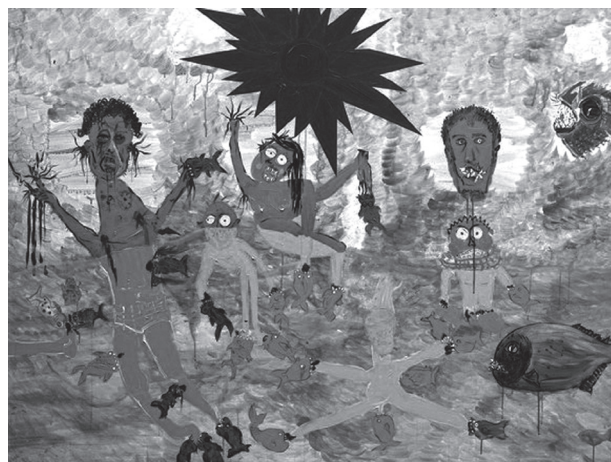
Václav Girsu: Na konci duhy, 2014