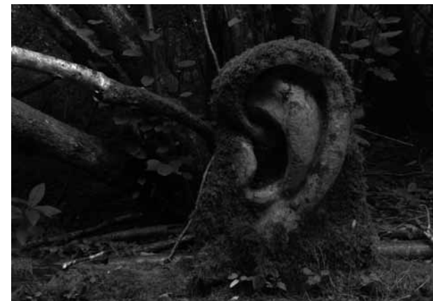
Znějící, rezonující, vibrující

Výstava je uspořádána jako součást festivalu Ostravské dny 2017. Představuje téma zvuku v tom nejširším slova smyslu. Vybraní umělci realizují do konkrétních prostor své představy o komponovaných zvukových prostředích, zabývají se vlastními prostorovými akustickými charakteristikami, připravují drobné zvukové události, uskutečňují terénní nahrávky, aby je přenesli do nových souvislostí, putují, aby návštěvníkům předložili zvukové cestovní raporty, vytvářejí zvukové objekty, zaznamenávají zvuky svého okolí, generují nové zvuky, realizují nejrůznější akustické jevy, demonstrují zvuky znějící hluboko pod hladinou běžné slyšitelnosti atd. Výstava se uskuteční v Ostravě a v Opavě současně na řadě míst. V Ostravě mají zájemci možnost výstavu zhlédnout v Galerii Dole, ve Fotografické galerii Fiducia, ve výstavní síni Sokolská 26 a v Galerii Lauby a v Opavě v Bludném kameni, Galerii Cella, v kapli sv. Alžběty a v Hovornách. Dovolujeme si upozornit na rozdílné termíny konců výstavy v různých výstavních prostorech. V Galerii Dole výstava potrvá do 15. 9. a ve FGG do 2. 9. 2017. Ve spolupráci se spolkem Bludný kámen.