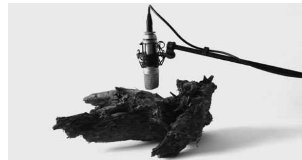
Znějící, rezonující, vibrující